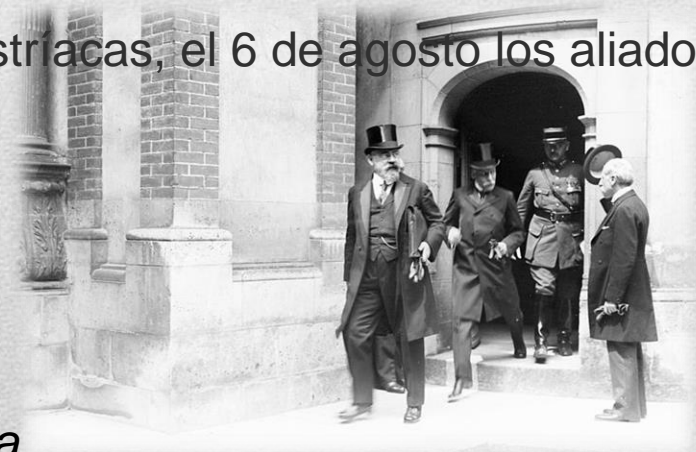
La delegación austríaca