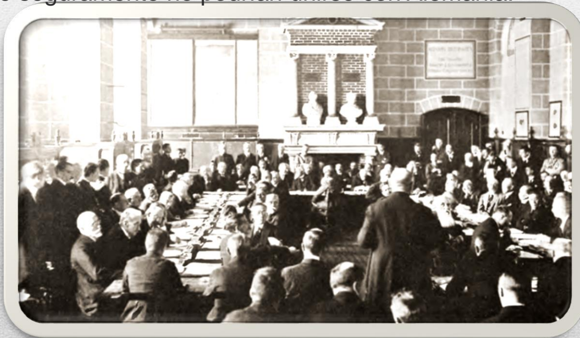
El jefe de la delegación austríaca, Dr. Karl Renner, se dirige a los otros delegados al recibir las condiciones del Tratado de paz de Saint Germain.