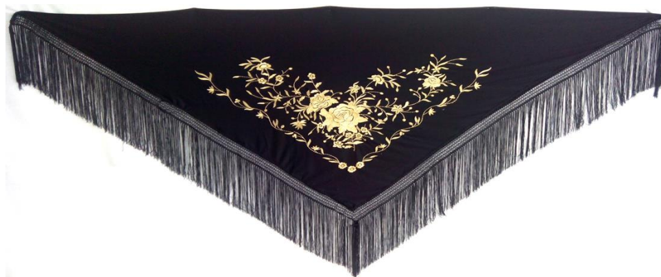
Mantón de Manila (tiene su origen en las sedas procedentes de la ruta con Asia)