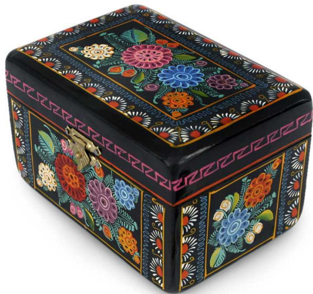
Cajita lacada de Olinalá (Guerrero, México)