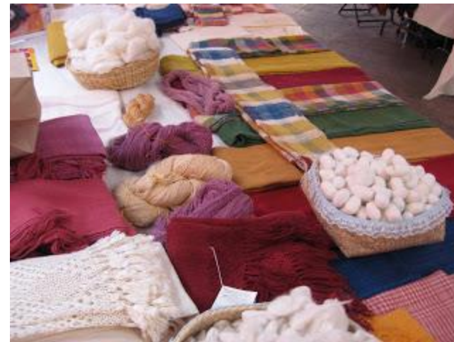
Sedas de Oaxaca (Feria de la Seda, Museo de Culturas Populares, Ciudad de México)