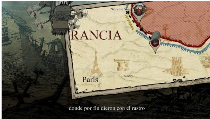
Figura 6 19