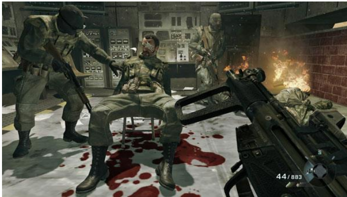
Figura 3 15 .

Por otro lado, si se analizan los juegos más vendidos, la diferencia es significativa. VGChartz publicó, el pasado mes de julio de 2014, un ranking de los videojuegos más vendidos, con independencia de su plataforma. Se puede ver que Wii Sport es el juego, hasta ahora, más vendido. Seguido del éxito Super Mario Bros