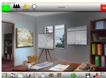
Figura 9 27

El jugador tomará el papel de líder de un movimiento popular quien tendrá que prepararse para la confrontación, pero siempre de forma no violenta. Es un juego de estrategia que tiene como misión mostrar cómo iniciar y controlar un movimiento social.