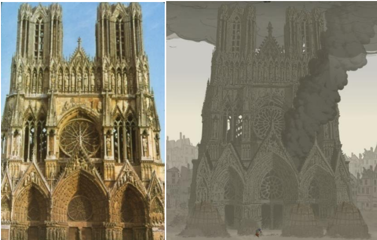
Figura 8 21 .

Una de las características más interesantes del videojuego es la aparición de alertas en la esquina superior derecha de la pantalla. No interrumpe el juego, pues para verlas, se debe dar a un botón del teclado. Cuando se abre la alerta se muestra una ficha con un acontecimiento histórico que está presente en la narración del juego. Además, existen dos botones que te permiten compartir estos detalles del juego en redes sociales. Por otro lado, la historia te permite visitar varias ciudades francesas además de vivir algunas batallas que tuvieron lugar en esta guerra.