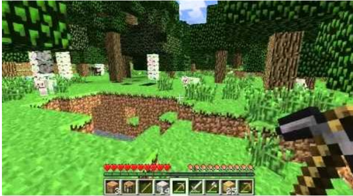
Figura 2 14 .