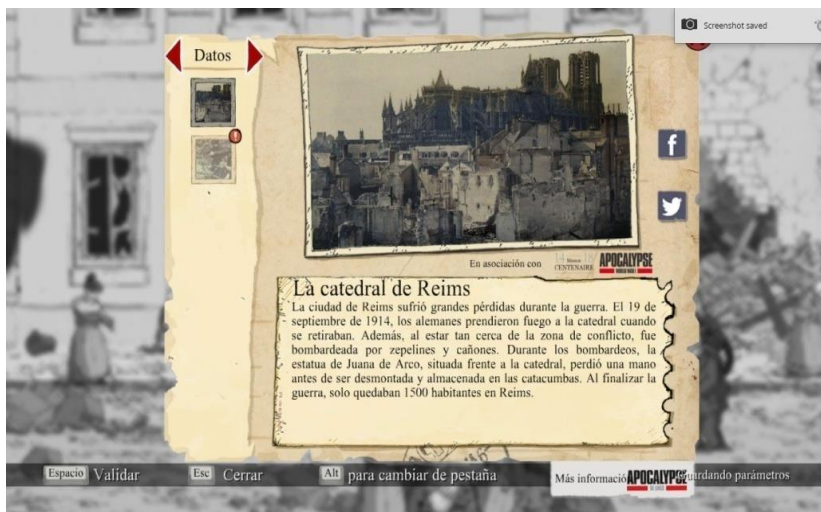
Figura 7 20 .