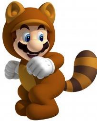
Figura 5 17 .

de NES 16 . En el puesto número tres se encuentra Mario Kart Wii, seguido por otro de los juegos de deporte de Nintendo, Wii Sport Resort. En resumen, aunque se pueda considerar la saga de Mario Bros como violenta, los juegos de deporte son los más elegidos por los compradores.