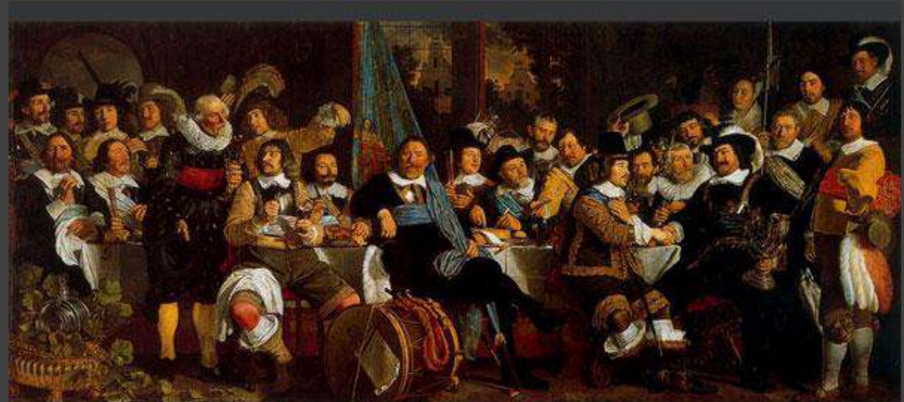
Celebración de la Paz de Westfalia (1648)

Recomposición del mapa político Europeo. Fin de la hegemonía de la casa Habsburgo. Predominio de los Estados Nación. Afirmación de la monarquía absoluta. Igualdad y libertad religiosa.